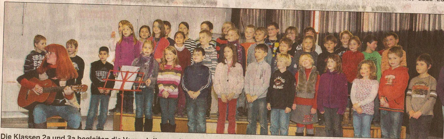
Die Klassen 2a und 3a begleiten die Veranstaltung mit einem lustigen Lied über die „Büchermäus“.